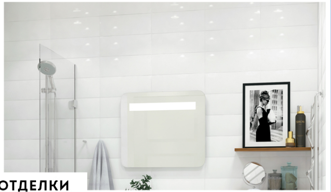
ПРИМЕР ОТДЕЛКИ ОТ ЗАСТРОЙЩИКА